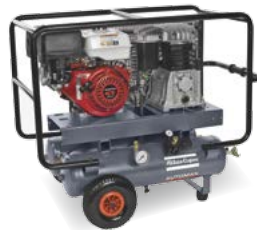
AC 56 + 71 E R Petrol