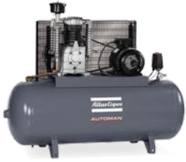
AC 40-15 T 300 T