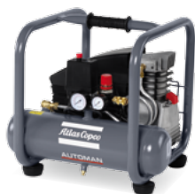
AF 25-10 E 6 M