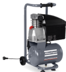
AF 25-10 E 10 M