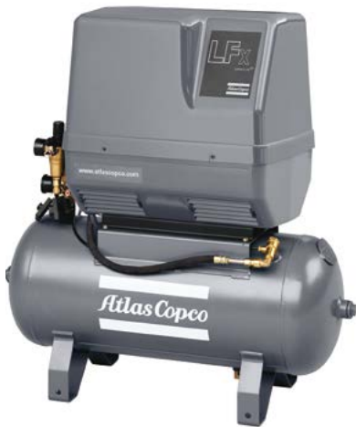
LFx montiert auf 50-l-Behälter

ölfrei verdichtende Kolbenkompressoren 10 bar | 0,55–1,5 kW