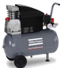
AF 20-10 E 24 M