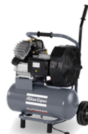
AF 30-10 E 24 M