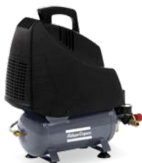
AH 15-8 E 6 M