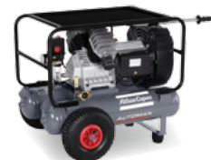
AF 30-10 E 2x11 M