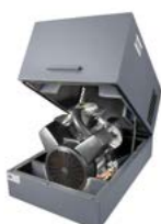
Pack Version Grundrahmen mit Schallhaube