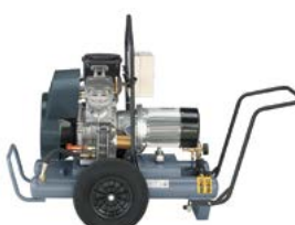
Trolley fahrbare Ausführung