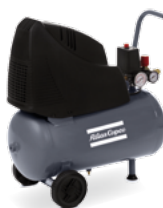
AH 15-8 E 24 M