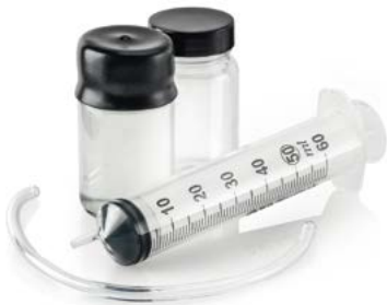
Zur Messung der Ölkonzentration am OSS-Ausgang ist ein optionales Probenkit verfügbar.

Das von geschmierten Kompressoren erzeugte Kondensat enthält Spuren von Öl und muss entsprechend aufbereitet werden, da Öl Umweltrisiken birgt. Kondensatlösungen von Atlas Copco ermöglichen es, Öl aus dem Kompressor-kondensat abzuscheiden und sicher zu entsorgen, bevor es ins Abwassersystem gelangt.