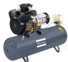
montiert auf Behälter