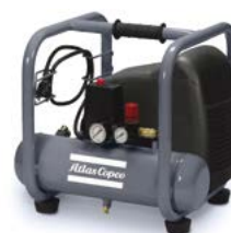
AH 20-8 E 6 M